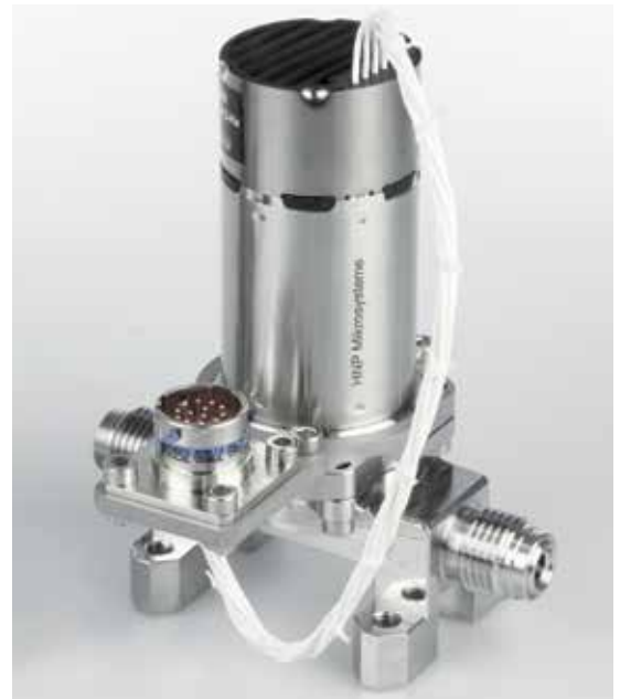
Magnetisch hermetische Pumpe mzh-7261 mit kundenspezifischer Ausstattung und Anschlusslösung.

Gekoppelt mit Wärmepumpen lässt sich die Technologie der Adsorptionskältemaschinen für Heizgeräte zur dezentralen Wärmeerzeugung nutzen. Fluorierter Alkohol mit hohem Dampfdruck wird als Kältemedium in einem Kreislaufsystem zirkuliert. Die Kühlflüssigkeiten weisen äußerst geringe Viskositäten von maximal 0,2 mPas auf. Ein Entweichen der leicht flüchtigen Stoffe während der Förderung wird durch den hermetischen Pumpenkopf verhindert.